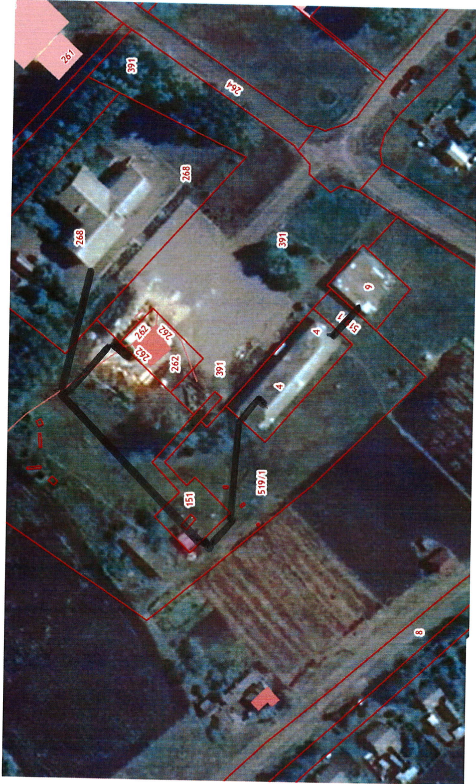
Схема теплоснабжения Нижнебайгорского сельского поселения Верхнехавского муниципального района Воронежской области